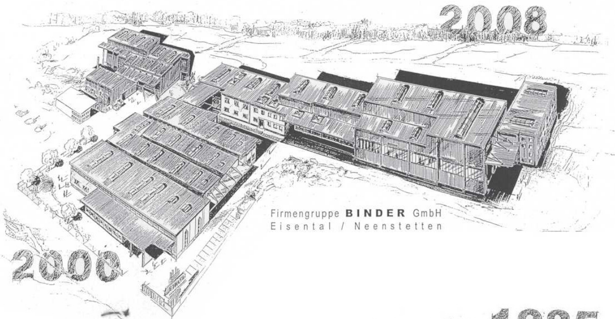
Firmengruppe BINDER GmbH Eisental / Neenstetten